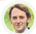
Arnaud DE BELENET LREM Élu